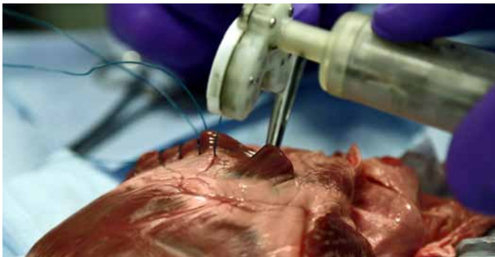
So funktioniert das automatische Instrument zum Wundverschluss: Eine sich drehende Nadel am Kopf des Instruments zum Wundverschluss setzt reproduzierbare Stiche für die Naht.