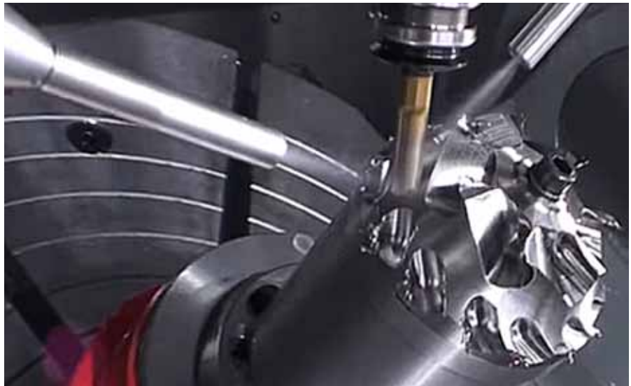
Bei der Titanbearbeitung steigert ATS-Cryolub das Zeitspanvolumen um bis zu 70 Prozent und senkt die Bearbeitungszeit pro Bauteil um bis zu 40 Prozent.

te Partikel zerstäubt wird. Der Ölnebel sorgt für eine spezielle und ausreichende Schmierung direkt an der Schnittstelle und verhindert so das Entstehen von Reibungswärme. Trotz des niedrigen Verbrauchs ist die optimale Schmierleistung gewährleistet.