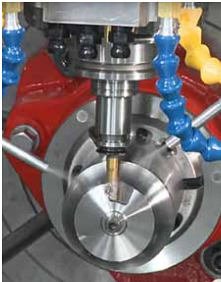
Beim Zerspanen hochwarmfester Stähle sind höhere Schnittwerte möglich.