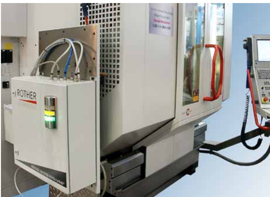
ATS lässt sich mit geringem Adaptionsaufwand nachrüsten beziehungsweise auf allen gängigen Bearbeitungszentren in Erstausrüstung integrieren.